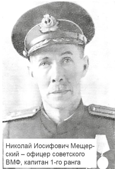
Николай Иосифович Мещерский – офицер советского ВМФ, капитан 1-го ранга

В 5 часов 47 минут, после того как наши самолёты отбомбились и улетели, в районе высадки появились 17 «юнкерсов». Корабли временно прекратили стрельбу по