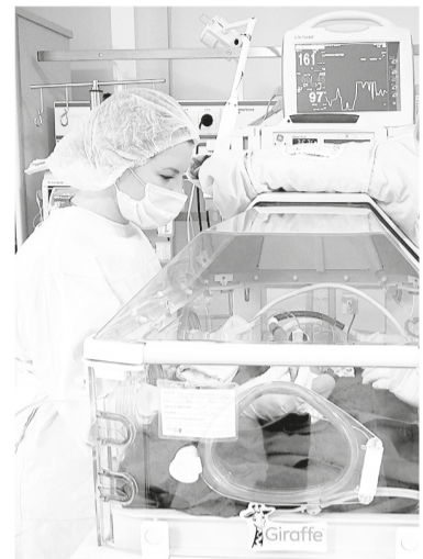
Врачи выхаживают малышей весом в 500 граммов

— Я родила в первый раз. Боялась до ужаса. Очень поддержали врачи, они не отходили от меня все 10 часов. Буквально держали за руку, общались, — признаётся