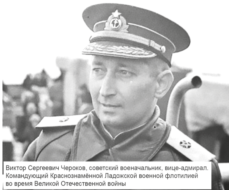
Виктор Сергеевич Чероков, советский военачальник, вице-адмирал. Командующий Краснознамённой Ладожской военной флотилией во время Великой Отечественной войны