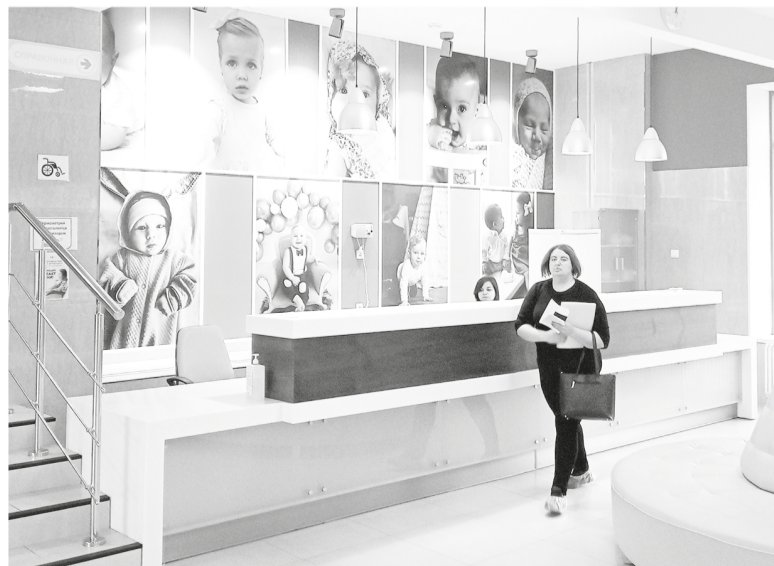
Перинатальный центр провёл фотоконкурс малышей

АЛЕКСЕЙ АСТАПЧИК ФОТО АВТОРА, АРХИВ ПЕРИНАТАЛЬНОГО ЦЕНТРА ЛОКБ