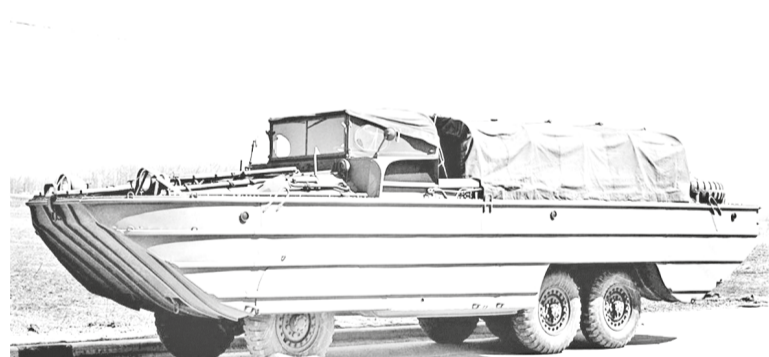
Амфибийное транспортное средство DUKW, поставленное Советам по ленд-лизу из США

огонь. Стреляющие батареи и пулемётные точки сразу же были засечены артиллерийскими наблюдателями, и по ним ударили советские орудия и миномёты. Воины-буксировщики заняли укрытия на противоположном берегу реки буквально в нескольких десятках метров от траншей противника и в течение всей артиллерийской подготовки находились в зоне огня нашей артиллерии. 16 храбрецов, участвовавших в демонстрации переправы, были удостоены звания Героев Советского Союза.